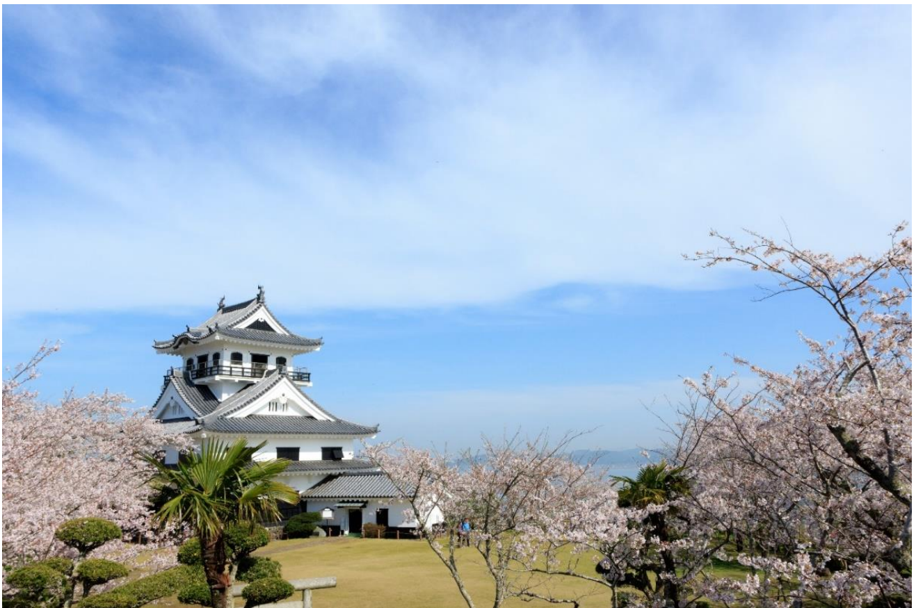
Château de Tateyama

Début avril, le parc attire beaucoup de monde qui vient y admirer les cerisiers en fleur et le Mont Fuji par beau temps.