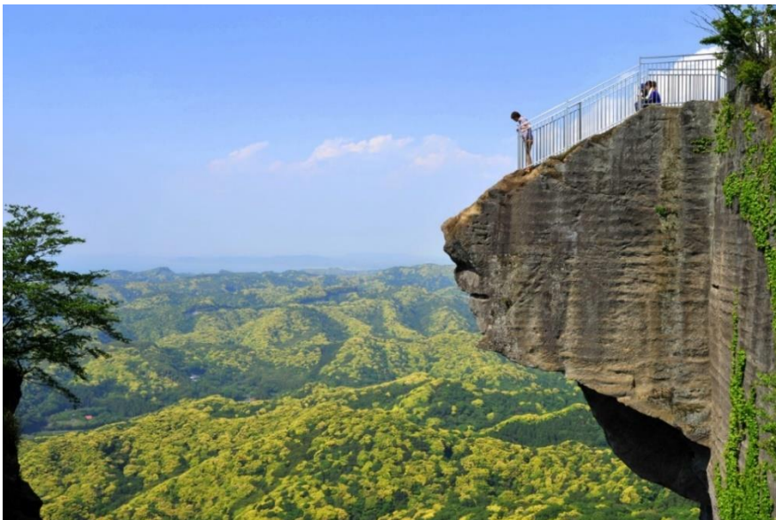
"Ishikiriba ato" (Ancienne carrière : Scène de pierre)

Ses parcours bien entretenus sont recommandés aux randonneurs débutants. L'on trouve en chemin de nombreuses attractions telles que les "Ishikiriba ato" (ancienne carrière) avec ses impressionnantes parois rocheuses verticales, le passionnant observatoire au sommet de la montagne "Jigoku nozoki" (un coup d'œil à l'enfer) et l'énorme Bouddha de Nihonji (Nihonji Daibutsu), haut de 31 mètres. Pour le retour, vous pouvez descendre en téléphérique.