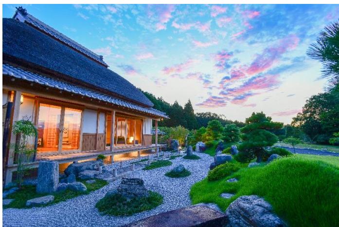
Jardins et chambre de Sasayuri-ann

Uda est une région située dans le nord-est de Nara. Niché dans le village de montagne de Fukano, le Sasayuri-Ann est une villa privée de style japonais offrant une vue sur les rizières ainsi que sur les monts Muro et Takami. Dotée d'un toit de chaume, cette villa à l'architecture traditionnelle dispose d'une cuisine moderne et d'une terrasse.