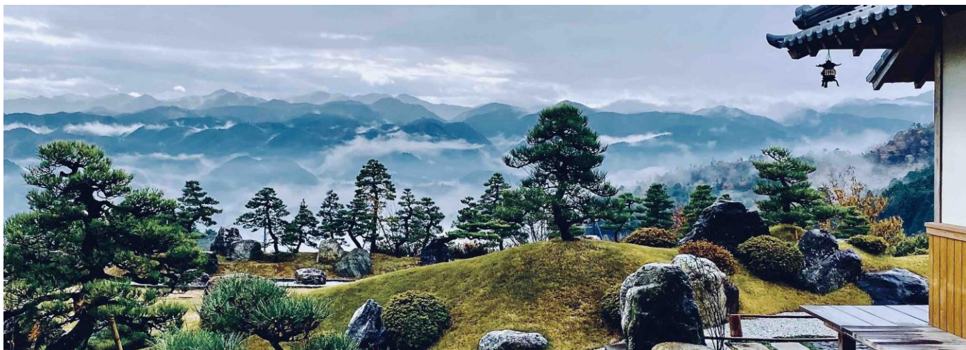
Vue à partir de Sasayuri-ann (Nara)

Départ en véhicule privé pour Sasayuri-Ann de votre hôtel à Kyoto, visites et déjeuner libres, dîner de Shabushabu ou Sukiyaki inclus. Nuit au Sasayuri-Ann. Check in à partir de 15h.