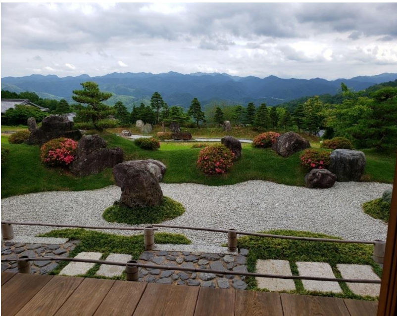
Jardins de Sasayuri-ann (Nara)