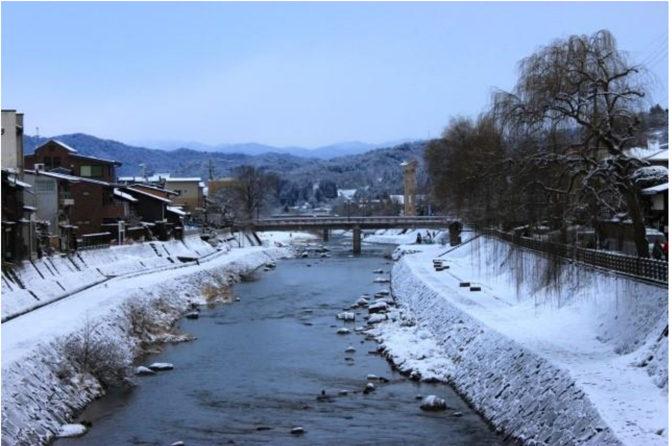
Rivière Miyagawa (Takayama)

Temps libre pour vos découvertes personnelles.