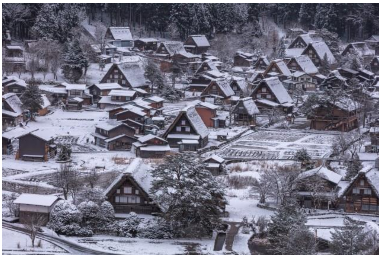
Village de Shirakawa-go (Gifu)

Visiter Shirakawago en hiver est un must. Les vieilles maisons de Gassho-zukuri dont les toits résistent à de fortes chutes de neige (plus de 50 cm), les stalactites de glace et les vues panoramiques enneigées depuis les sites d'observation créent un paysage unique. Autrefois, Shirakawago était bloqué par la neige (neiges de plus de 1.5m de hauteur) et n'y avait pas beaucoup de touristes en hiver. Aujourd'hui l'accès y est plus facile et les visiteurs peuvent profiter des paysages originaux et enneigés de ce village éloigné et reclus.