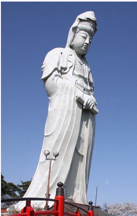
Statue de Kannon Byakue (Takasaki)