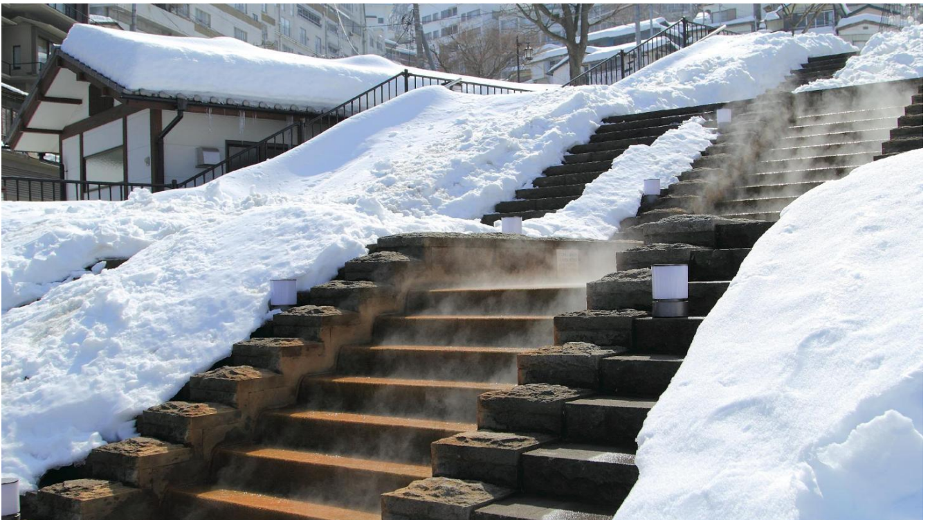
Les 365 marches de Ikaho Onsen avec source thermale (Shibukawa)