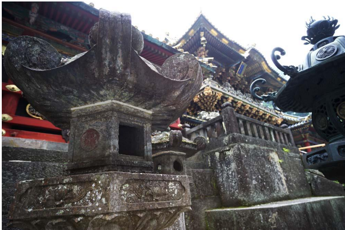
Temple Toshogu (Nikko)