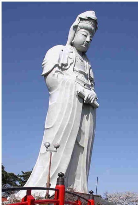
Statue de Kannon Byakue (Takasaki)

Illumination du lac Haruna et spectacle de feux d'artifice les soirs d'hiver.