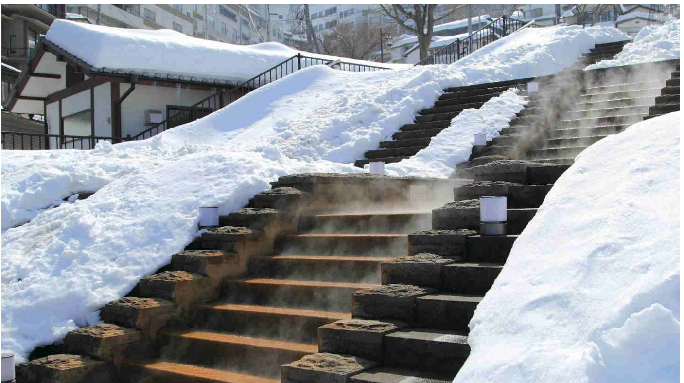
Les 365 marches de Ikaho Onsen avec source thermale (Shibukawa)

Les 365 marches de pierre sont renommées comme un symbole de prospérité de la ville thermale de Ikaho pour chaque jour de l'année. Elles ont été construites il y a plus de 400 ans et ont été rénovées en 1980.