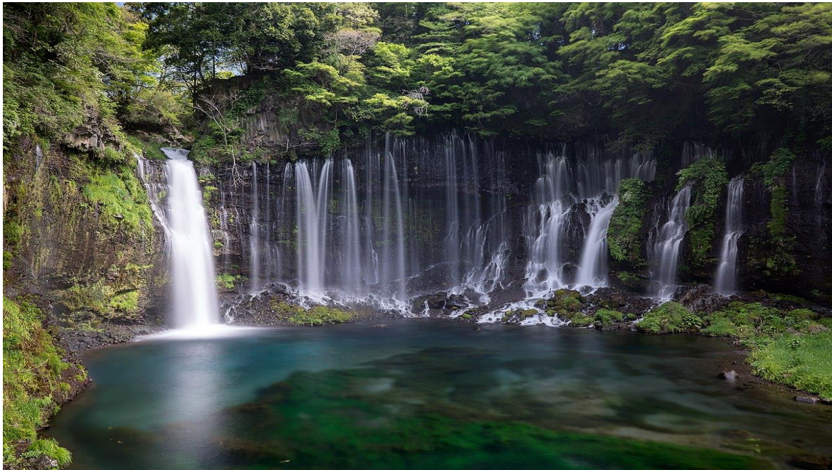
Chutes Shiraito

Ces chutes sont situées à 5 minutes à pied des chutes de Shiraito. Il y a une vieille histoire selon laquelle lorsque les frères Soga envisageaient de venger l'ennemi de leur père, Kudo Suketsune, le bruit de la cascade s'est arrêté pendant un moment. La cascade (littéralement les « chutes antibruit ») a été nommée d'après ce conte.