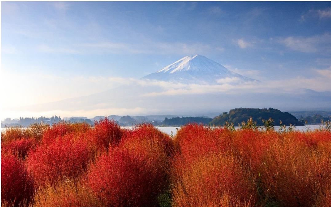
Vue sur le Mont Fuji

Plateau qui culmine à 307m au centre de la ville de Shizuoka. Nihondaira est célèbre pour les vues fantastiques qu'il offre sur le mont Fuji. Le paysage en automne est particulièrement beau.