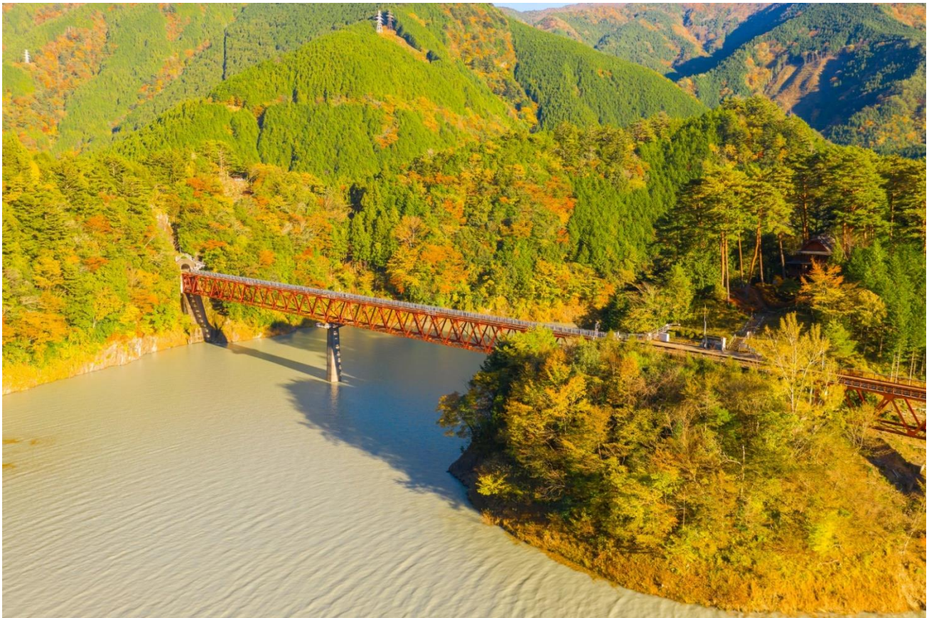
Oigawa Road (Shizuoka)

La région de Shizuoka très appréciée pendant l'automne, est connue pour accueillir 3 des meilleurs paysages du Japon à cette période. Premièrement les cascades de Shiraito et Otodome, toutes deux situées dans le parc national de Fuji-Hakone-Izu offrent une vue tout en contraste entre le mont Fuji et les feuilles colorées. Les gorges de Sumata quant à elles sont connues pour leur célèbre pont suspendu : le "Dream Suspension Bridge" qui offre une vue exceptionnelle sur la magnifique vallée de la rivière Sumata et son eau bleue.